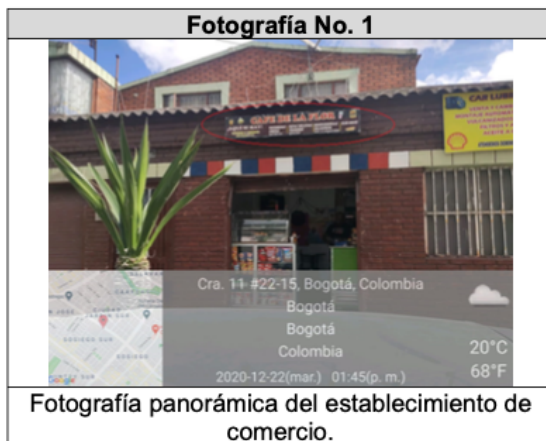
Fotografía panorámica del establecimiento de comercio.